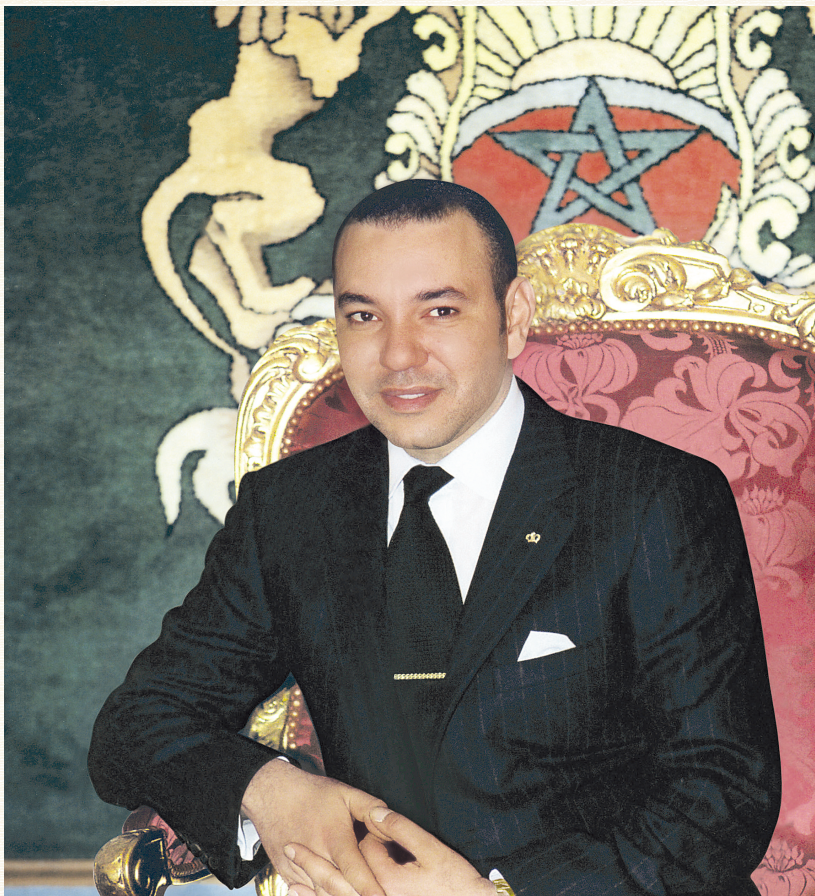
صاحب الجلالة الملك محمد السادس نصره الله