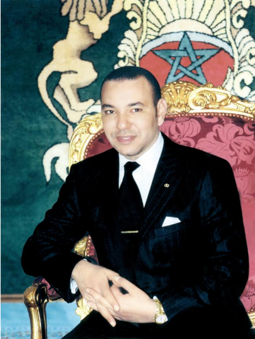
صاحب الجلالة الملك محمد السادس نصره الله