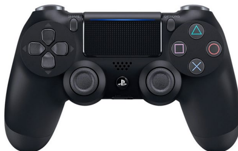
Figure 1 – Manette sans fil DualShock®4

disponibles à la vente séparément. L'image ci-dessous montre une manette DualShock 4 dans sa version sans fil.