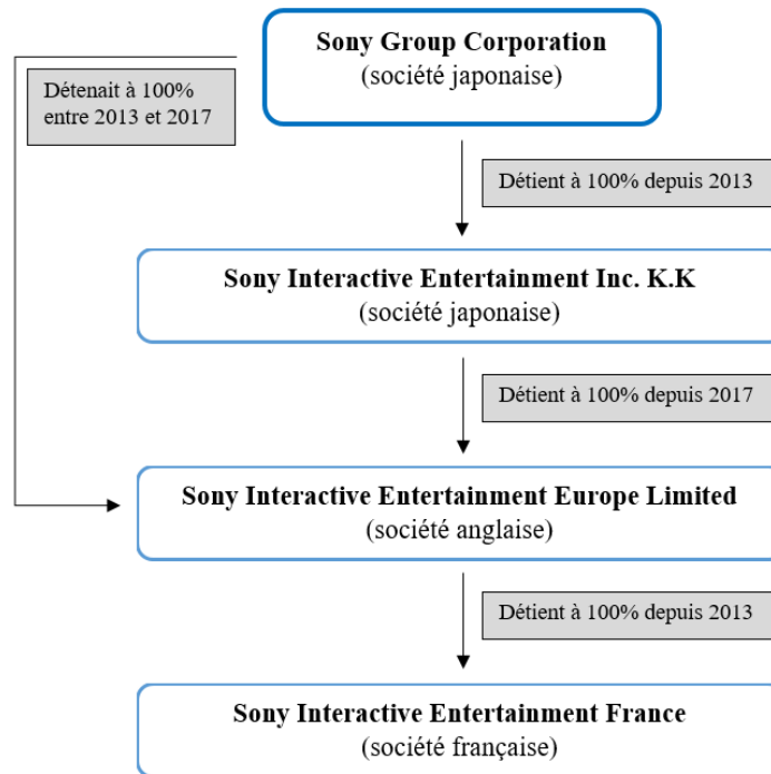
Figure 3 : Schéma des filiales du groupe Sony